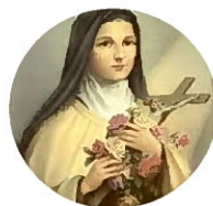
リジューのテレーズ