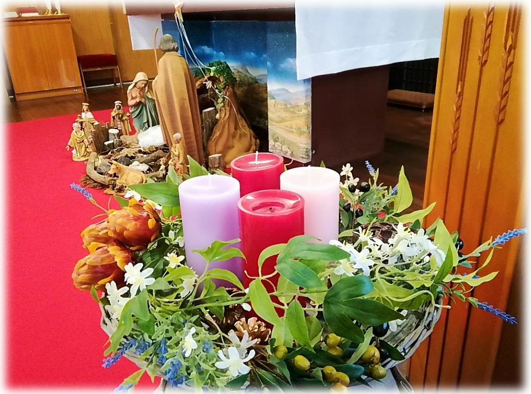
宇治カルメル会修道院