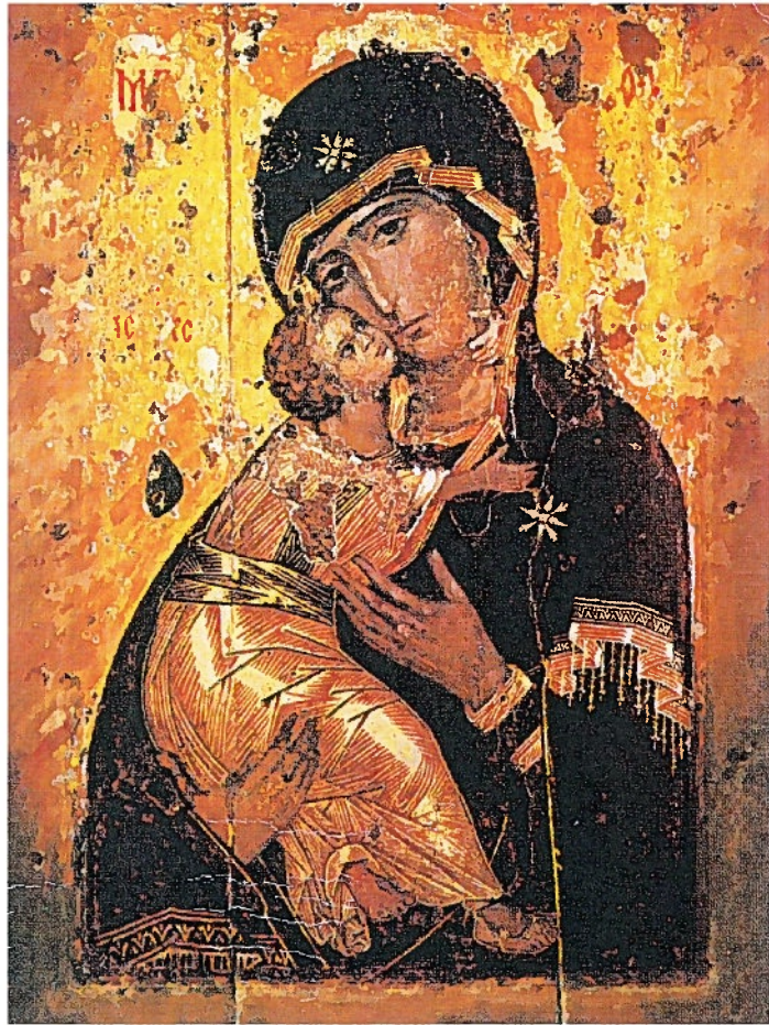
神の御母 ウラジュミル